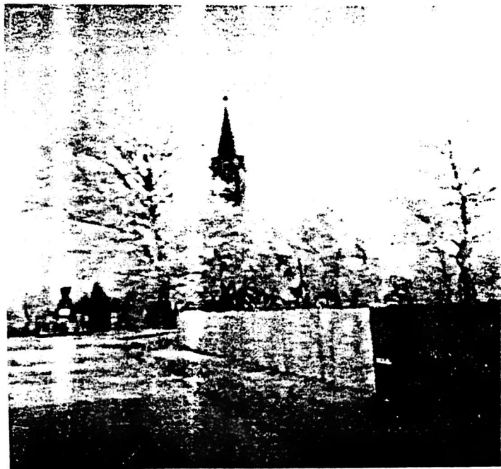
Január utolsó reggelére megérkezett a téli varázslat: hófűgöngyö lepte be a tájat.