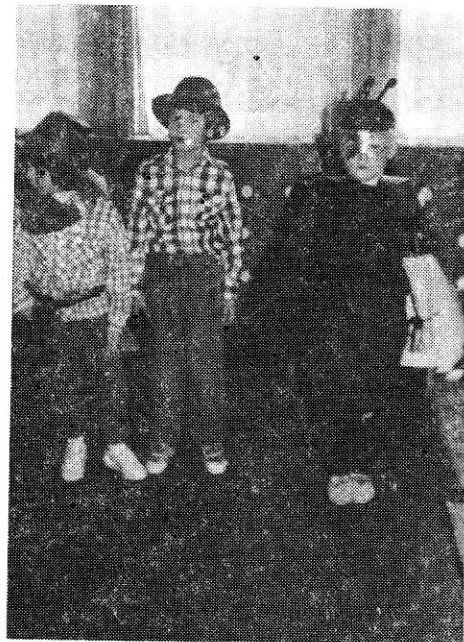
Képünk a farsangon készült.

Vasszécseny-Szentpéterfa 2:2, Vép-Vasszécseny 0:0, Torony-Vasszécseny 0:0.