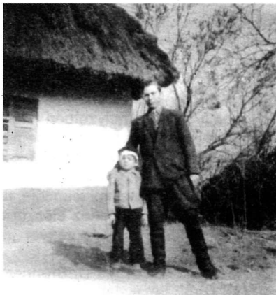
Ilyen zsuppos házak égtek le akkor

„Július 9-e egy vasárnapi nap volt. Én a község tehénpásztorával a teheneket őriztem a réten, amikor sötét viharfelhők tornyosultak a falu fölött. Hatalmas szélvihar kerekedett, dörgés, villámlás, és egy villám belecsapott a Székeskáptalan cselédházába. Varga János bácsi épp azon a padláson aludt. A zsupptető rögtön lángra kapott, és a hatalmas szélviharban rögtön továbbterjedt a tűz. Először a Főszög irányába terjedt át házról-házra. 5-6 ház, meg több pajta égett le. Ekkor a szélirány megfordult és ellenkező irányban az Őszög házaira vitte át a tüzet. Gerezsdek pajtájáról a szél az égő zsuppot a közbirtokossági pásztorházra vitte át, innét a Szkok malomig a falu mind leégett. Abban az időben a falu gazdálkodó emberekkel volt tele, minden istálló tele volt marhákkal, ezeket kellett először menteni. Amit ki tudtak menteni, az megmaradt, ami bennmaradt, az bennégett. Még szerencse, hogy azok a marhát, amiket kint őriztünk a legelőn így megmaradtak. Az emberek a dobogó hídra állva elállták a megrémült állatok útját, amik mindenáron haza akartak menni. Mind a tűz martaléka lett volna, ha ezt nem teszik.