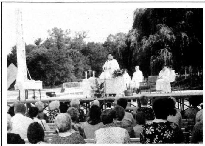
Tábori mise a Falunapon