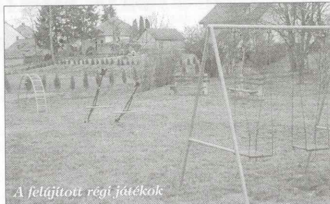
A felújított régi játékok