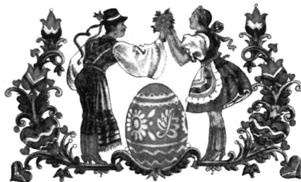
Kellemes Húsvéti Ünnepeket