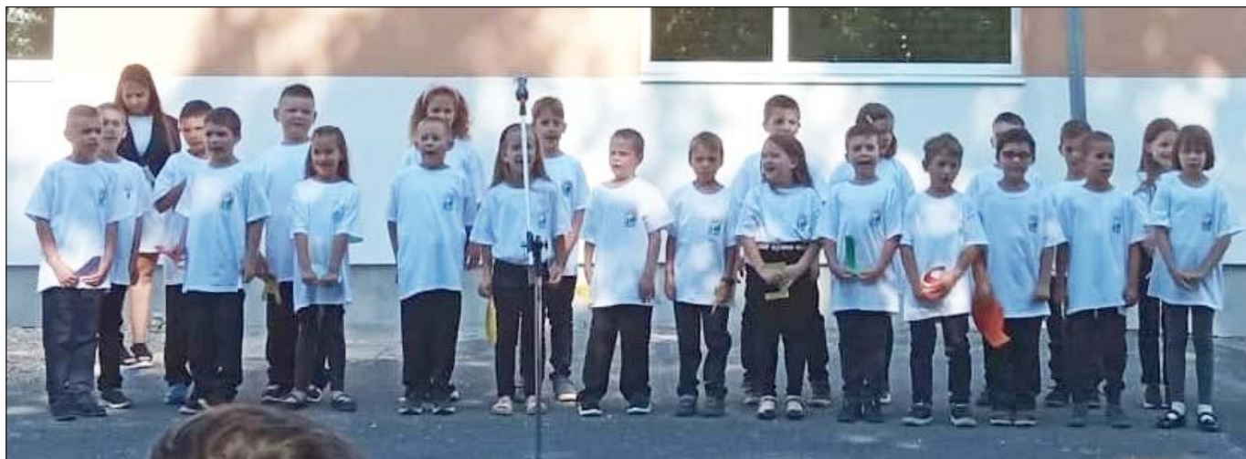
Az első évfolyamosok remek műsorát követően iskolánk polgáraivá avattuk őket.